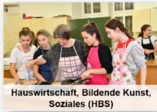
Hauswirtschaft, Bildende Kunst, Soziales (HBS)