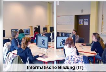
Informatische Bildung (IT)

Aus diesen Fächern setzt sich der Wahlpflichtschnupperkurs der 6. Klasse zusammen