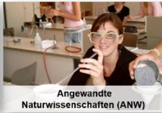
Angewandte Naturwissenschaften (ANW)

Aus diesen Fächern setzt sich der Wahlpflichtschnupperkurs der 6. Klasse zusammen